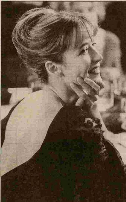
Sophie Marceau photographiée par François-Marie Banier, Paris, 1999.

EXPOSITION. François-Marie Banier s'est fait connaître par ses romans mais ce sont ses portraits des grands de ce monde que la Maison européenne de la photographie présente depuis hier. Sophie Marceau, Nicole Kidman, Mick Jagger..., tous ne jurent que par lui.