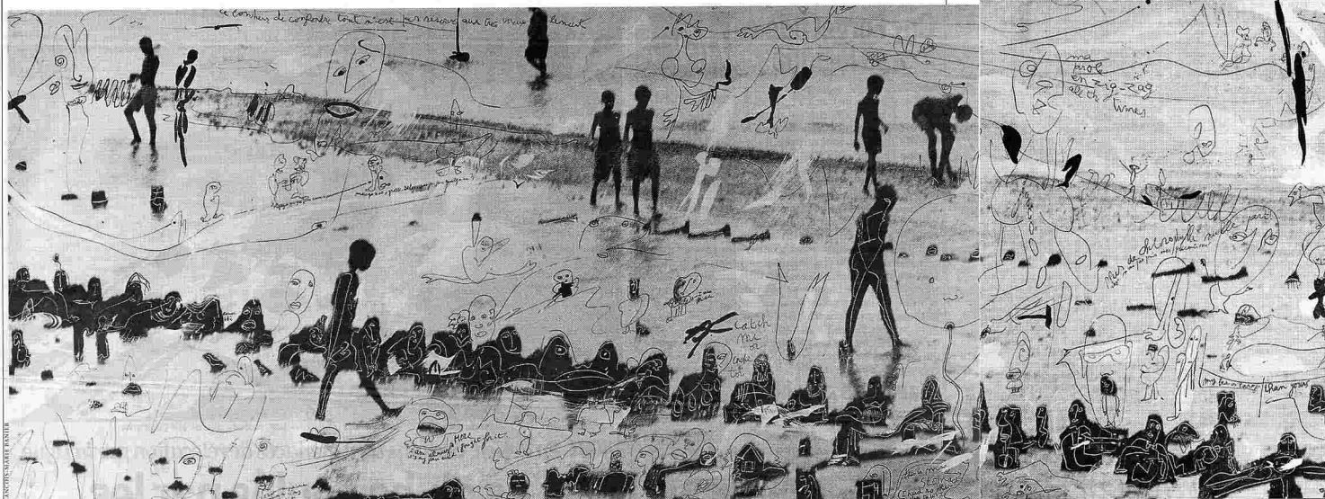
«Salvador de Bahia», 2002, encre sur photographie (120 x 320 cm). Banier a repris certaines photographies, les couvrant de peinture ou de mots jetés comme des bouteilles à la mer.

PHOTO. Deux cents images de François-Marie Banier à Paris: