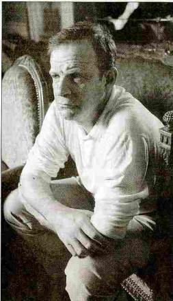
François-Marie Banier par le photographe Martin d'Orveau.

La photo photographique a l'habitude de ce qu'il y a montrer. Un coup de foudre entre un homme et une femme, entre deux hommes, entre deux femmes, c'est un million de seconde. Et bien, la photographie, c'est ça. Un coup de foudre. Par exemple, hier, je suis parti en voiture pour faire des photos et les seuls humains que j'ai photographiés,