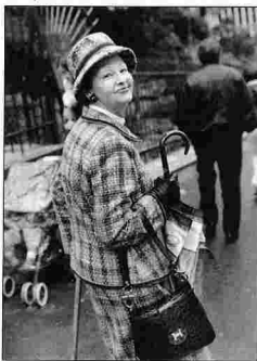
Que serait Paris sans ses Parisiennes ? Et que serait la photo sans ces clichés pris inopinément sur le macadam de la capitale ?

« Perdre la tête », de François-Marie Banier, éd. Gallimard, 265 pages, 28 euros.