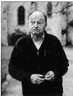
Claude Lévi-Strauss (en bas), Michel Tournier (ci-dessus) et une mère et ses enfants : voilà l'univers de François-Marie Banier.