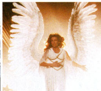
Salvateur. L'ange Emma Thompson dans « Angels in America », de Mike Nichols.