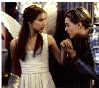
Héroïque. Leo DiCaprio et Claire Danes dans « Roméo + Juliette », de Baz Luhrmann.