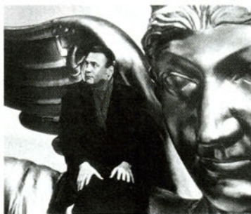
Cultissime. L'ange Bruno Ganz choisit de devenir humain par amour dans « Les ailes du désir », de Wim Wenders.