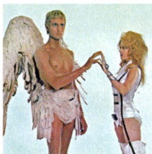
Rencontre du 3 e type. Jane Fonda face à l'ange dans « Barbarella », de Roger Vadim.